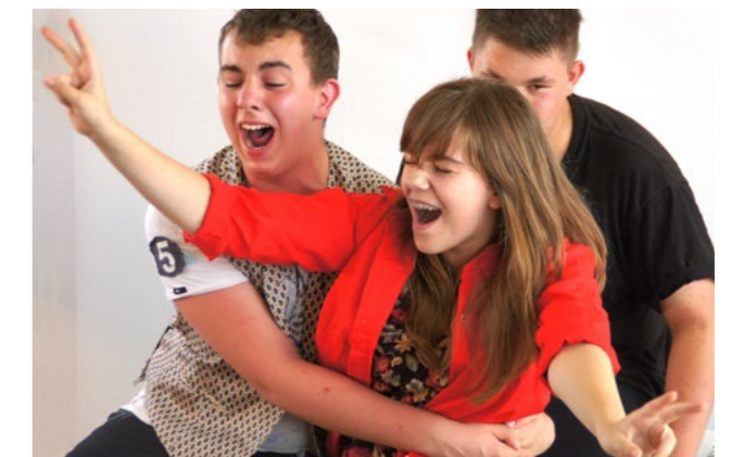
Rückblende: Kennen lernen in der Achterbahn