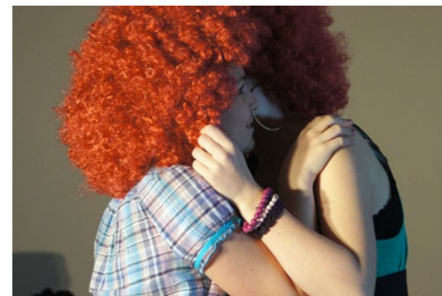
Unser doppeltes Lottchen beim Planschmieden des Rollentausches

Lieblingsszene von allen wurde das Kennenlernen der Eltern in der Achterbahn. Ein ängstlicher junger Mann muss seine Wettschuld einlösen und begibt sich