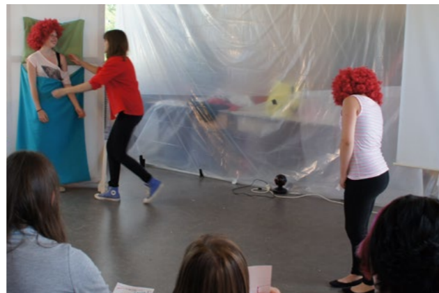
Generalprobe vor geladenen Mitschüler_innen in der Aula

Das Stück bekommt den Namen: Lockenkopf hoch 2 und die Gruppe nennt sich Skurriler Pasch . Unter Anleitung einer Tanzchoreographin erarbeiteten sich die Jugendlichen Teile des Stückes tänzerisch. Rollen entwickelten sich, über Körperübungen wurden Haltungen und Tics gefunden. Kostüme, Requisiten und ein Bühnen-