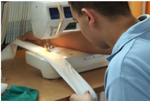
Erstellung der Kostüme und Requisiten bei einem Intensivwochenende

widerwillig in die Achterbahn. Eine junge Frau setzt sich auf den freien Platz neben ihm. Ihr scheint die Fahrt nichts auszumachen, sondern im Gegenteil – sie scheint Gefallen an der 90° Kurve zu finden. In einen Anflug von Unbehagen während der Fahrt klammert er sich an sie – und eine Romanze beginnt. In der Originalgeschichte Kästners stört die zukünftige neue Frau des Vaters die Wiedervereinigung der Familie, diese Figur schien nicht mehr zeitgemäß und wurde kurzerhand von den Jugendlichen gestrichen. Eine neue Rolle wurde kreiert: Onkel Torsten kümmert sich gemeinsam mit dem Vater um die Erziehung von Luisa und unterstützt sie zudem bei ihrem Hobby, dem Boxen. Die Art der Beziehung zwischen Vater und Onkel Torsten wurde nicht festgelegt und offen gelassen. Ob die Eltern wieder zu einander finden, das ganze eine „on-off-Beziehung“ wird, die Mutter mit Onkel Torsten durchbrennt oder der Vater und Onkel Torsten heiraten – all das waren mögliche Szenarien für die Jugendlichen. Doch das Ende bleibt offen und bietet weiteren Spekulationsspielraum für das Publikum.